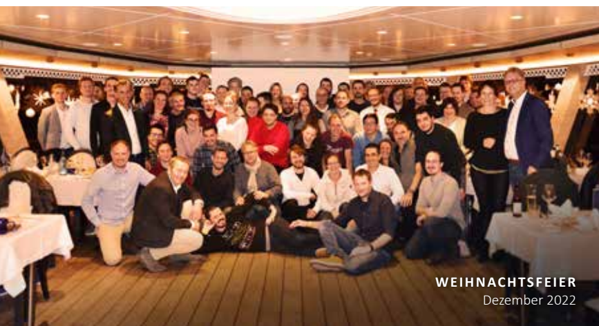
WEIHNACHTSFEIER Dezember 2022