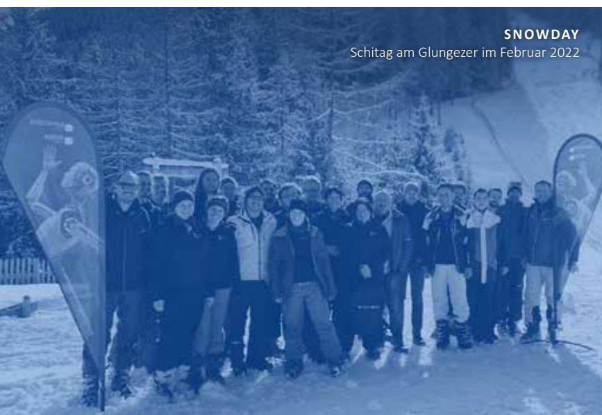
SNOWDAY Schitag am Glungezer im Februar 2022

„Auch ich bedanke mich – und zwar beim gesamten Team - für das tolle Miteinander hier. Da geht man doch jeden Tag gerne zur Arbeit. Ich freue mich auf weitere Jahre...“